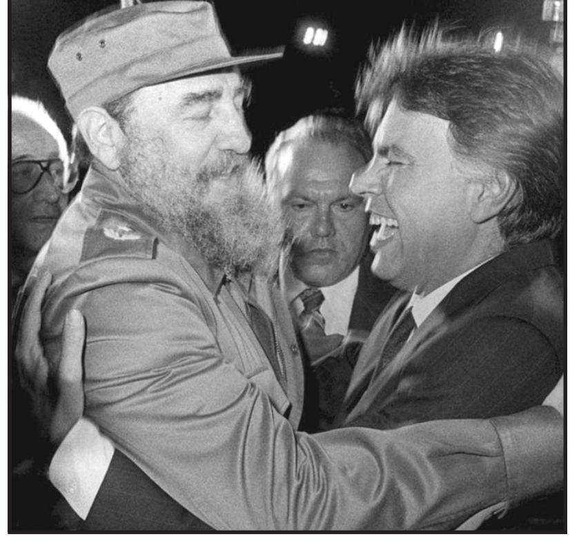
Fidel Castro recibe a Felipe González en el aeropuerto José Martí de La Habana

Continuación, Viene de la edición anterior... vino, cerveza y crudos de langosta el clima fue relajado, aunque por el trasfondo de las relaciones circulaban corrientes subterráneas: a Fidel no se le olvidaba que Felipe había renunciado al marxismo en el XXVIII Congreso del PSOE (1979), y, menos aún, que su amigo acababa de meter a España en la OTAN, algo que no le gustaba nada. El barco en el que salieron a pescar tenía fascinado a González —era un regalo del expresidente mexicano Luis Echeverría—, y se quejó del escándalo que le habían formado en España por navegar en el Azor, que no era ni la mitad de grande. "Es que eso no se hace, Felipe. Un yate de Franco se le vende a un magnate norteamericano por una tonelada de dólares, y después, por media tonelada te compras un igualito a este", fue la respuesta del comandante, recuerda Bryce Echenique en sus antememorias Permiso para vivir.