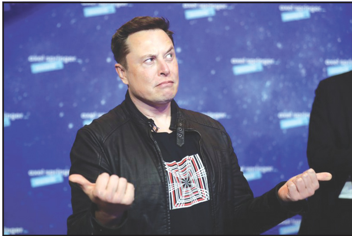
El fundador de la compañía, Elon Musk, alega motivos medioambientales para suspender las transacciones

El consejero delegado de Tesla, Elon Musk, informó el miércoles por la noche de que la compañía de vehículos eléctricos dejará de aceptar el bitcoin como forma de pago para adquirir sus coches debido a su impacto medioambiental. La decisión llega solo 50 días después de que se abriera esa posibilidad a sus clientes en Estados Unidos, y ha tenido repercusiones inmediatas: nada más conocerse la noticia, el precio del bitcoin cayó con fuerza. Pasadas las doce de la mañana hora española cotizaba en 49.600 dólares, con pérdidas superiores al 12%.