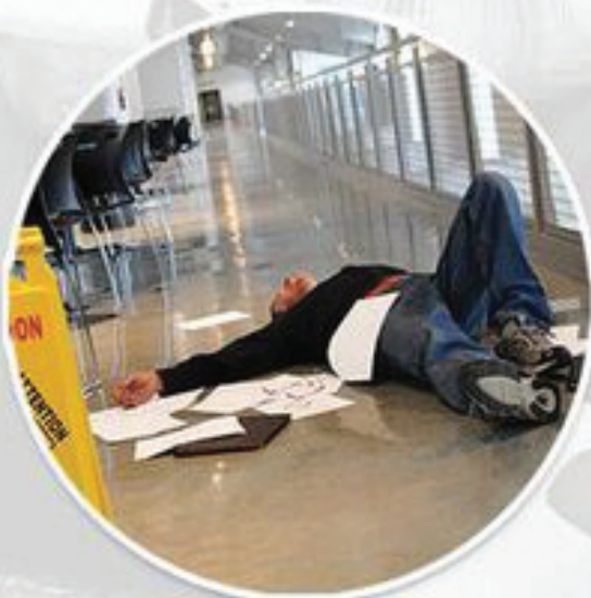
Dramatización. Actor Pagado.