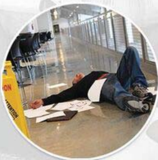
Dramatización. Actor Pagado.