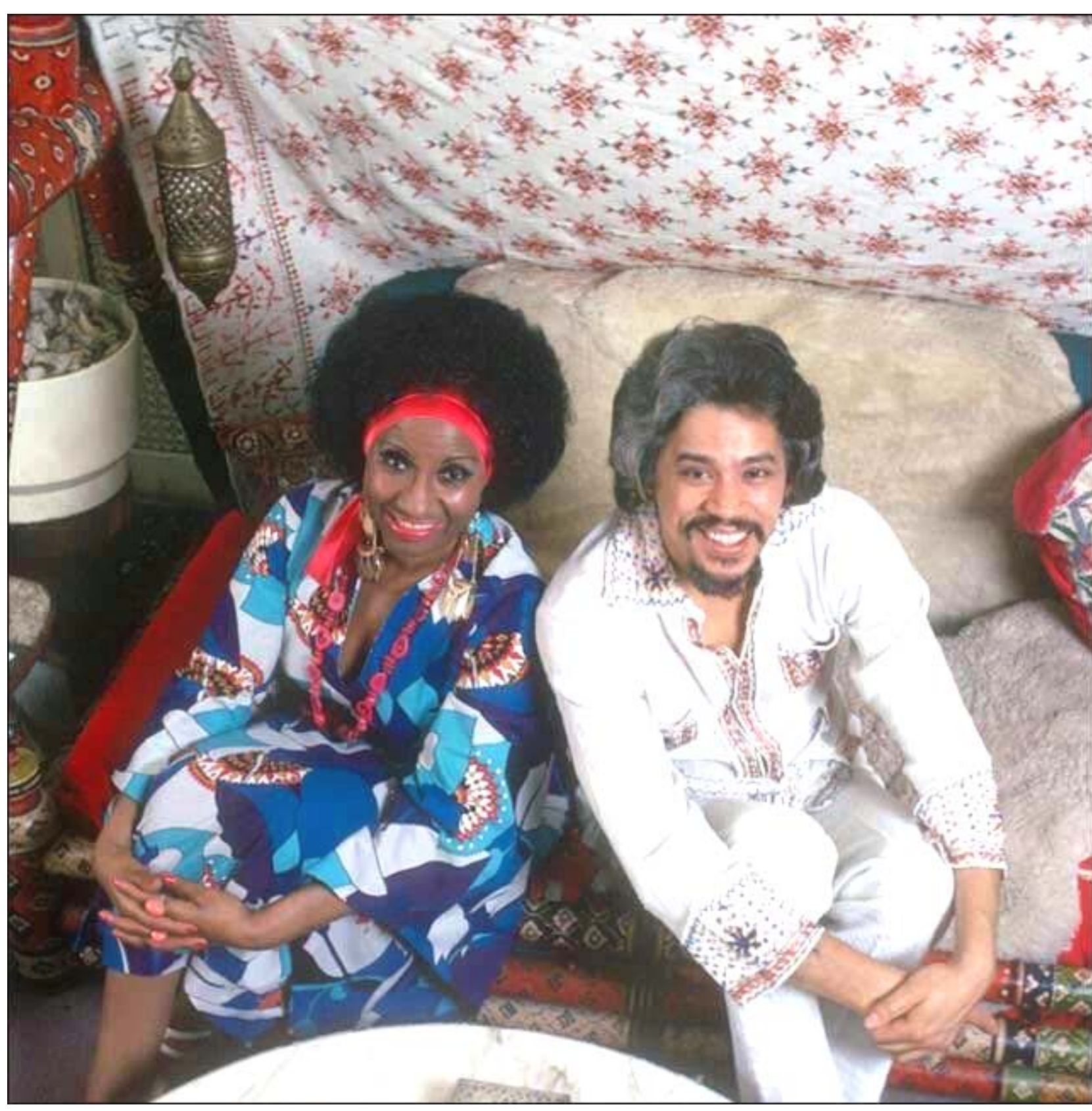
Celia Cruz junto a su eterno amigo, "El Padrino de la salsa"

A los 11 años se trasladó junto a su familia a Nueva York, donde pudo continuar sus estudios musicales de percusión en