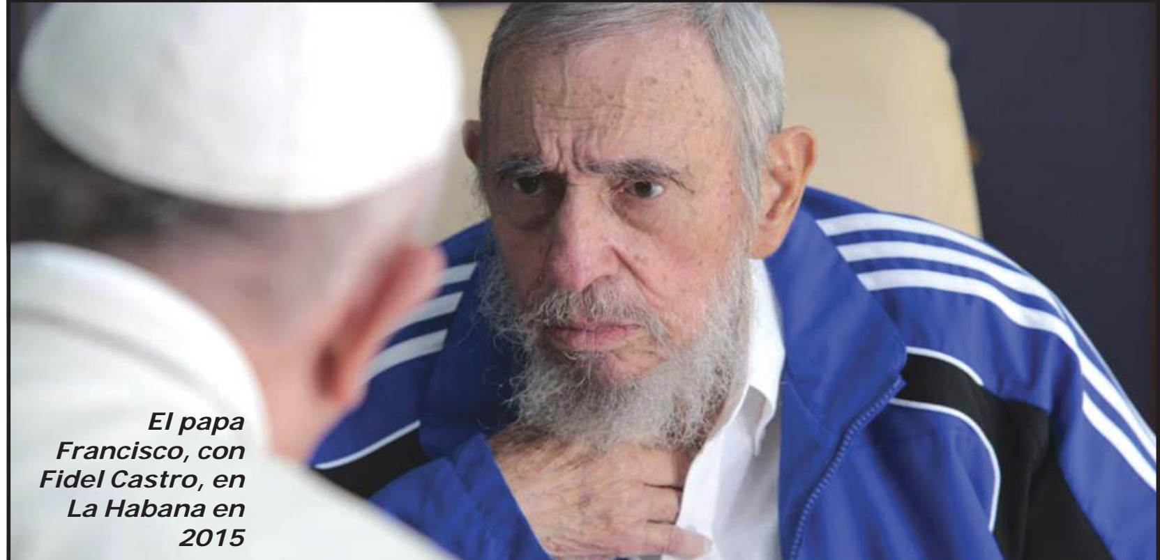
El papa Francisco, con Fidel Castro, en La Habana en 2015

Sin subyugarse con el carisma del personaje, “el primer historiador de sí mismo”, sobre la nove-