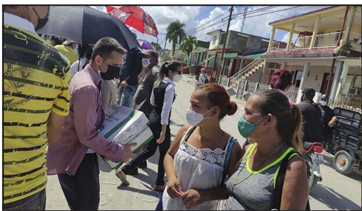
El Gobierno anula las restricciones anunciadas la semana pasada sobre las entregas por la libreta

El Gobierno dio marcha atrás este viernes a la medida tomada la semana pasada de eliminar la venta racionada de pollo a los cubanos mayores de 14 años, que tendrían que conformarse con picadillo y mortadella. El cambio coincide con la llegada al puerto de La Habana de un contenedor de pollo, cuyo arribo constató 14ymedio. En una breve nota, el Ministerio de Comercio Interior informó de que la comercialización del pollo de la canasta familiar normalda inició este viernes en Camagüey, mientras que la distribución en las demás provincias dependerá de la futura disponibilidad del alimento. La institución detalló que los niños hasta los 13 años recibirán una libra y media de carne y, a