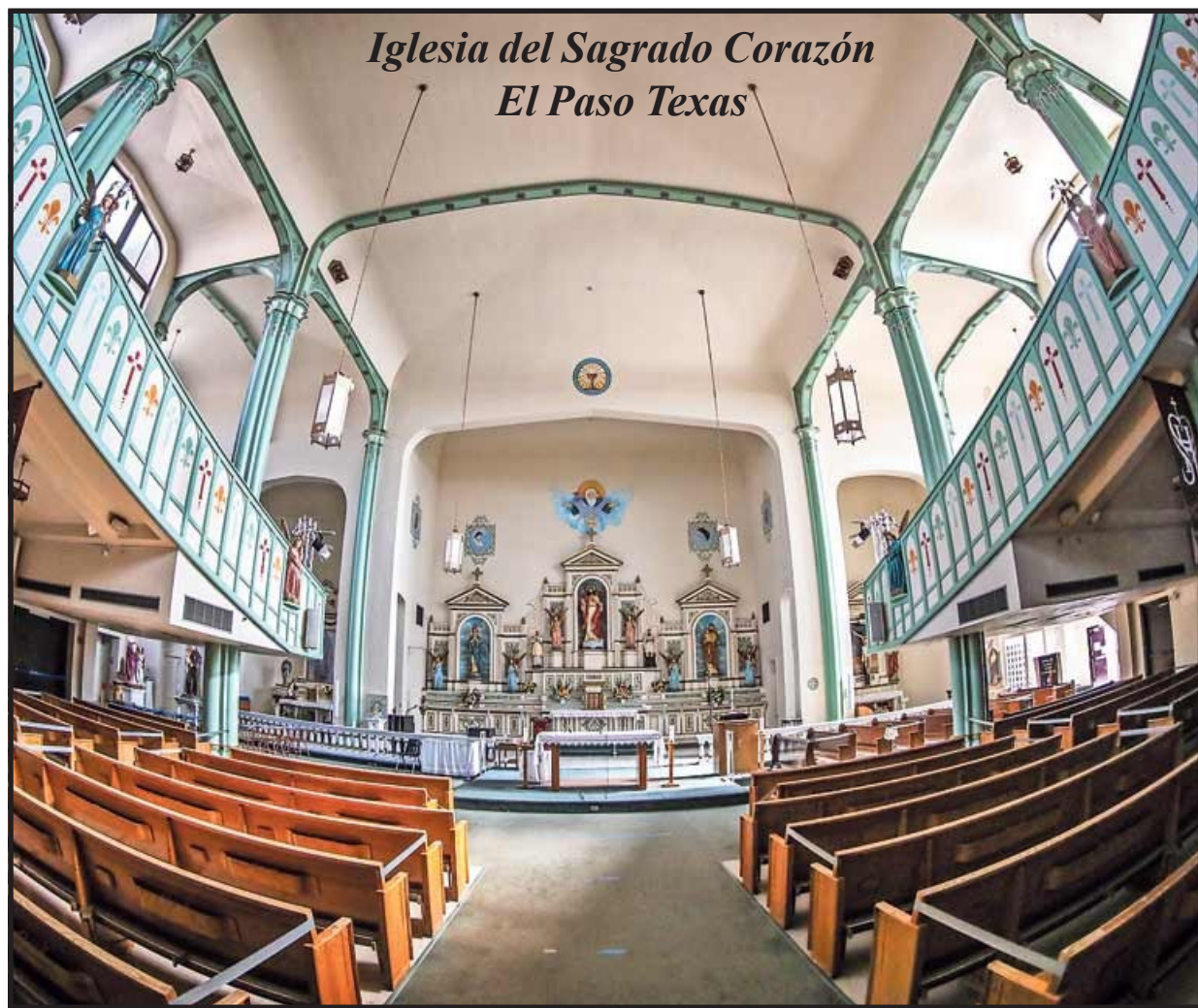
Iglesia del Sagrado Corazón El Paso Texas

Los reclutadores del gobierno de Florida se enfocaron en la iglesia católica del Sagrado Corazón en la ciudad fronteriza de El Paso, Texas, en busca de solicitantes de asilo que pudieran trasladar desde su bullicioso refugio de mi-