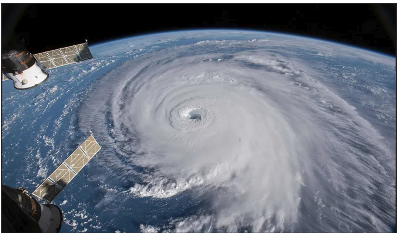
El paso de un huracán puede ser catastrófico y la experiencia indica que la planificación con tiempo evita la pérdida de vidas humanas y disminuye los daños

De cualquier manera, puede llamar al 311 para obtener información en es-