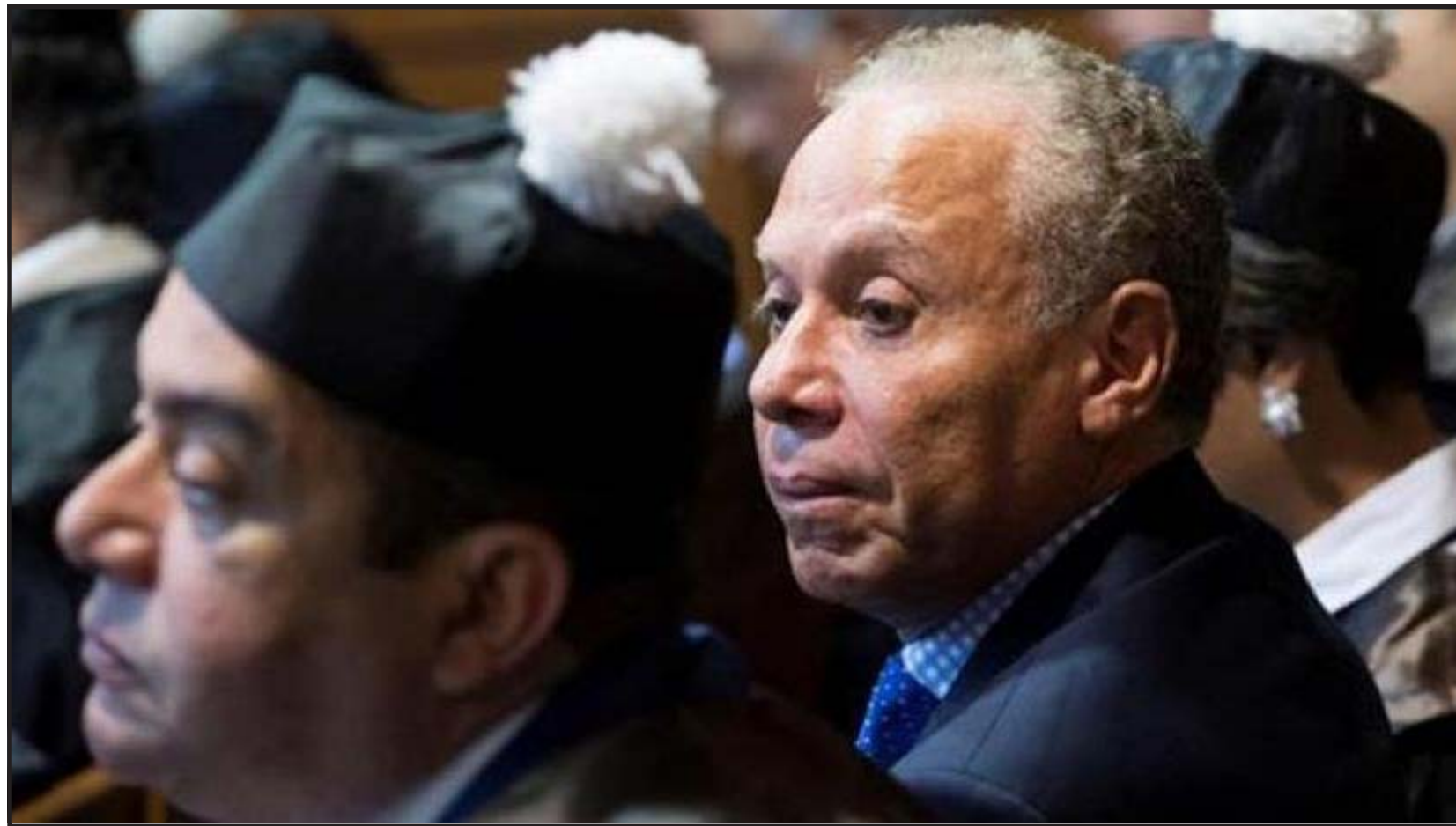
Rondón fue sancionado el 21 de diciembre del 2017, por decisión de la OFAC, que desarrolla e implementa el programa de sanciones global 'Magnitsky'

"Como hemos expresado de manera consistente, los Estados Unidos siguen profundamente preocupados por la corrupción en la República Dominicana. Estamos dispuestos a apoyar al Gobierno de la República Dominicana en sus