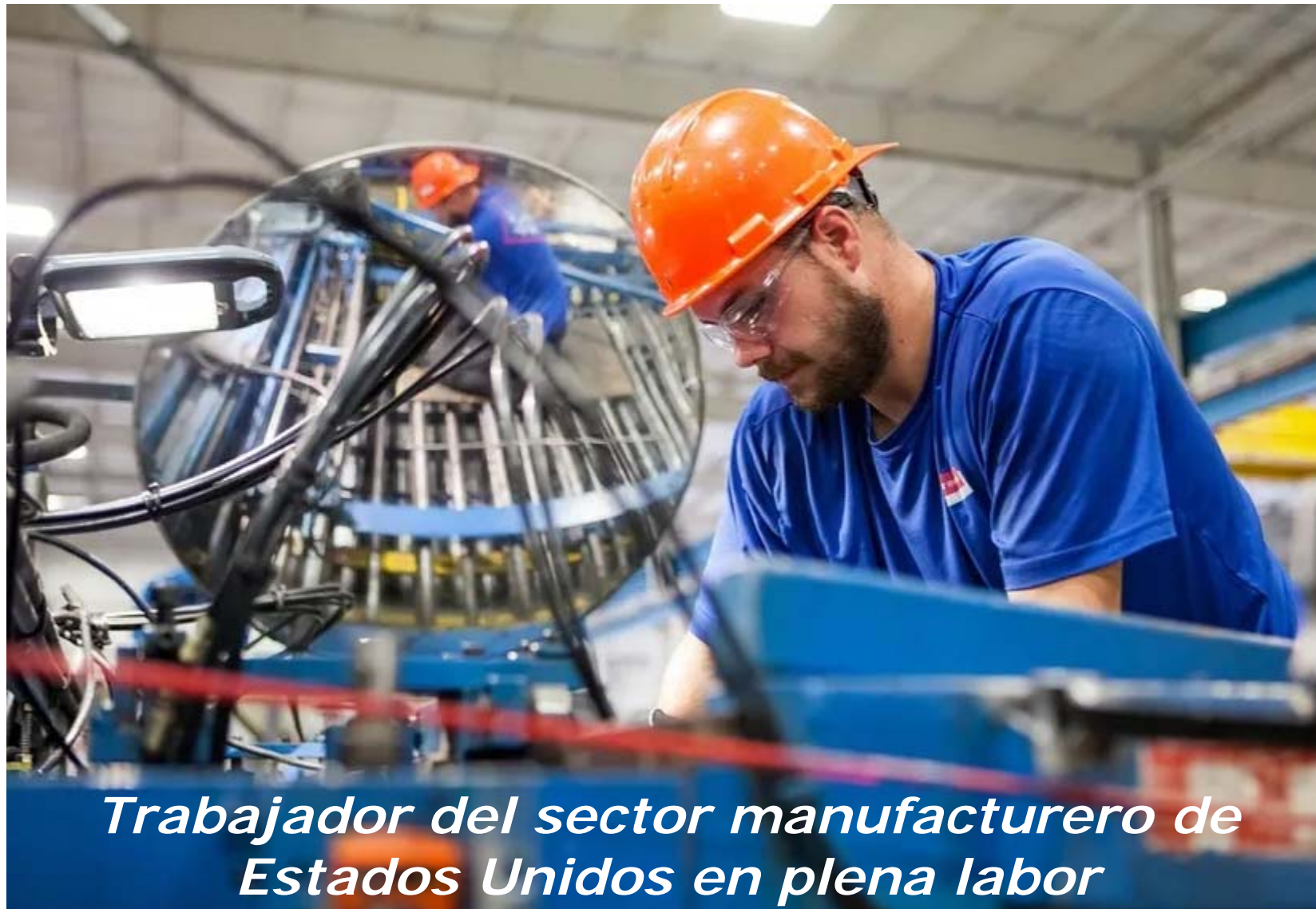
Trabajador del sector manufacturero de Estados Unidos en plena labor

"Estados Unidos busca una relación económica saludable con China que beneficie a ambas partes", declaró Yellen antes de re-