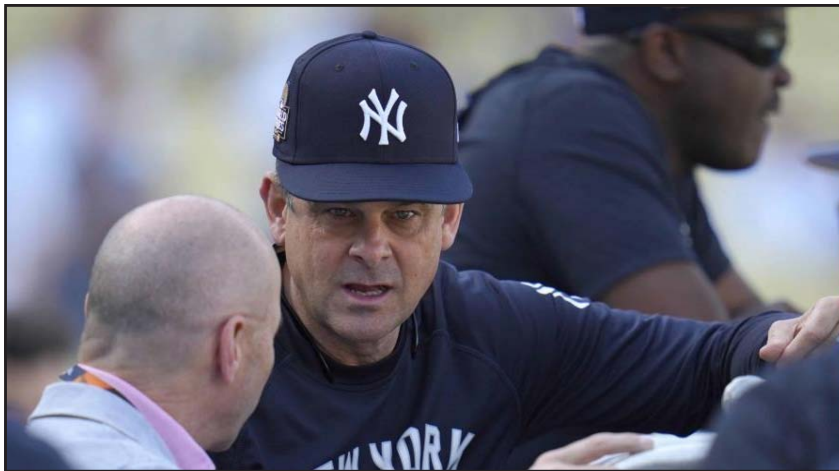
Aaron Boone (derecha), manager de los Yankees de Nueva York, habla con el gerente general Brian Cashman antes del primer juego de la Serie Mundial, el 1 de octubre de 2024 en Los Ángeles

Boone ha llevado a los Yankees a un récord de 603-429, tres títulos de la División Este de la Liga Americana y un campeonato del Joven Circuito en siete temporadas. Boone dijo que no había pensado