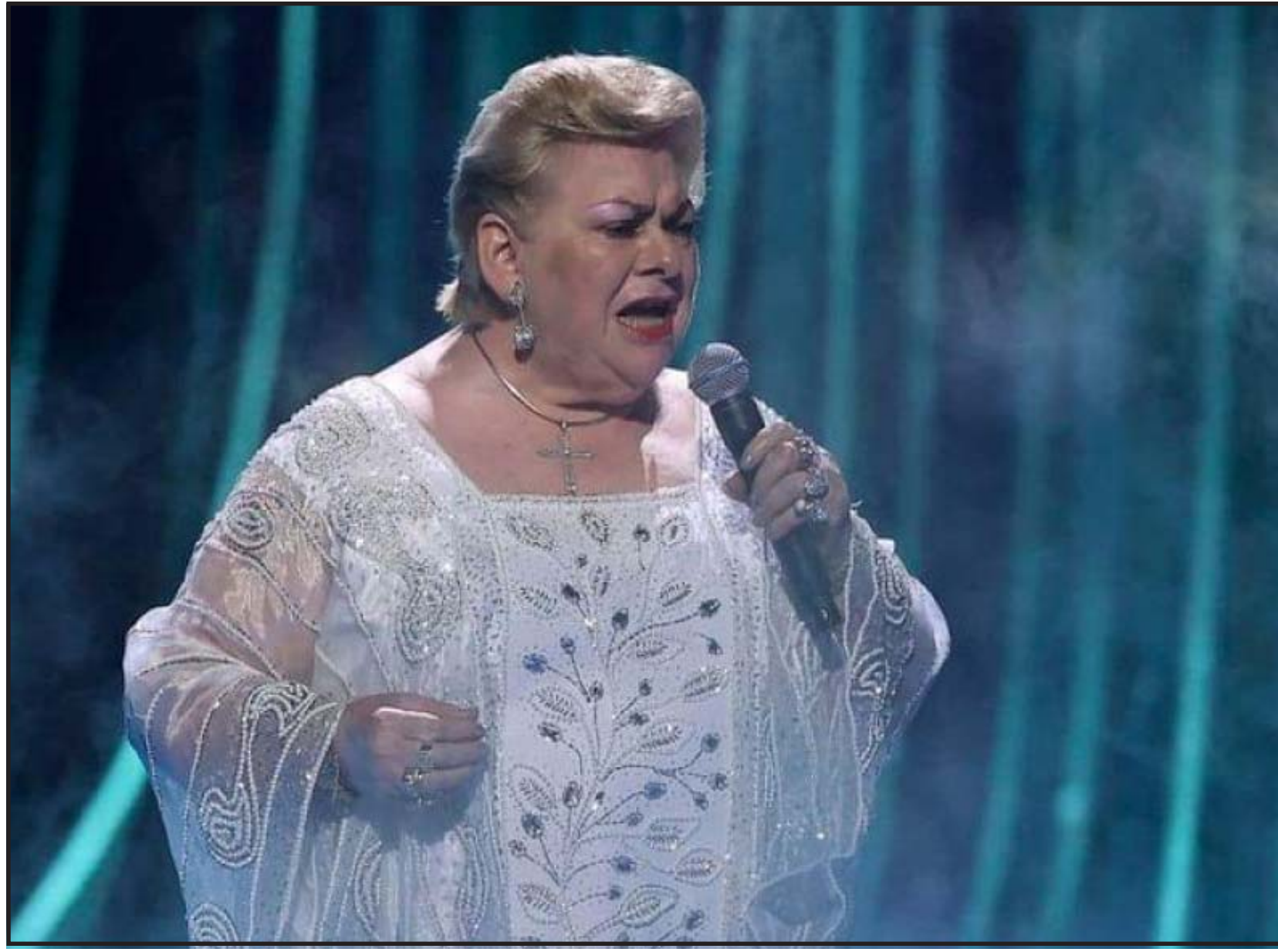
La familia no detalló las causas del deceso de la artista, nacida el 2 de abril de 1947 en el oriental estado de Veracruz y una de las cantantes más emblemáticas del género regional mexicano

A finales de enero, la salud de la veterana intérprete empezó a causar preocupación tras su equipo haber cancelado uno de sus conciertos por dolor en la