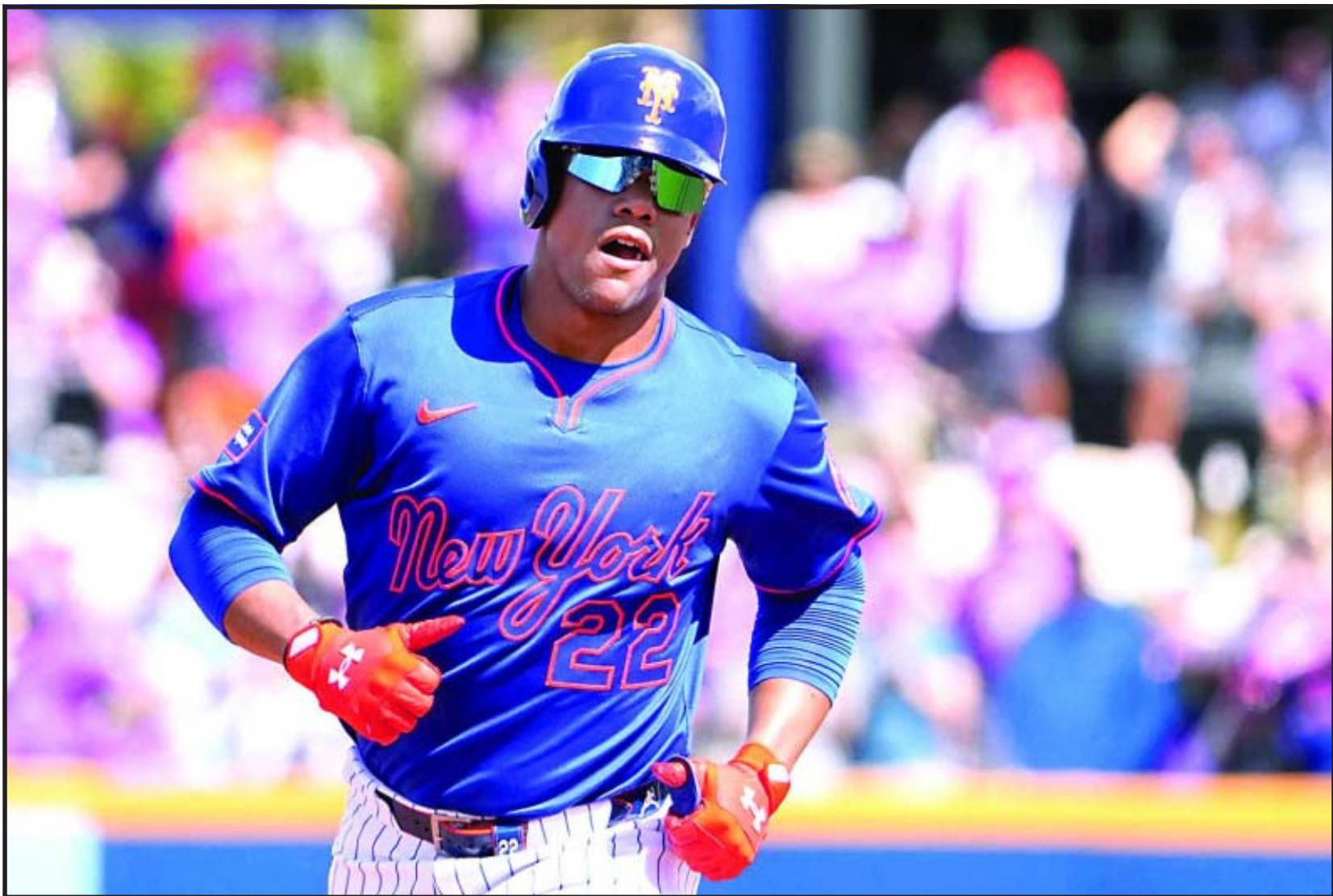
Sin contar a los que están recuperándose de lesiones ni los que lucha por últimos puestos en el roster, la cantidad de criollos para el día de apertura se eleva a 89