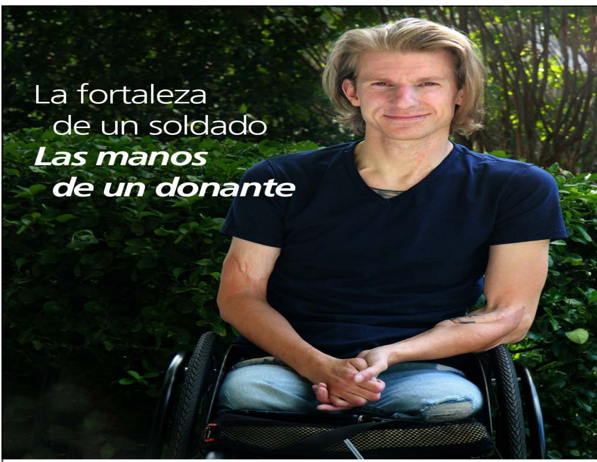
La fortaleza de un soldado Las manos de un donante Cuando el sargento Brendan Marrocco perdió las cuatro extremidades en Irak, también perdió su independencia. Luego, un donante de manos y brazos se la devolvió. Conozca cómo estos trasplantes innovadores – llamados alotrasplantes compuestos vascularizados (VCA) – están devolviendo la esperanza y cambiando vidas.

Concede el regalo de la vida como donante de órganos. donaciondeorganos.gov Sign Up