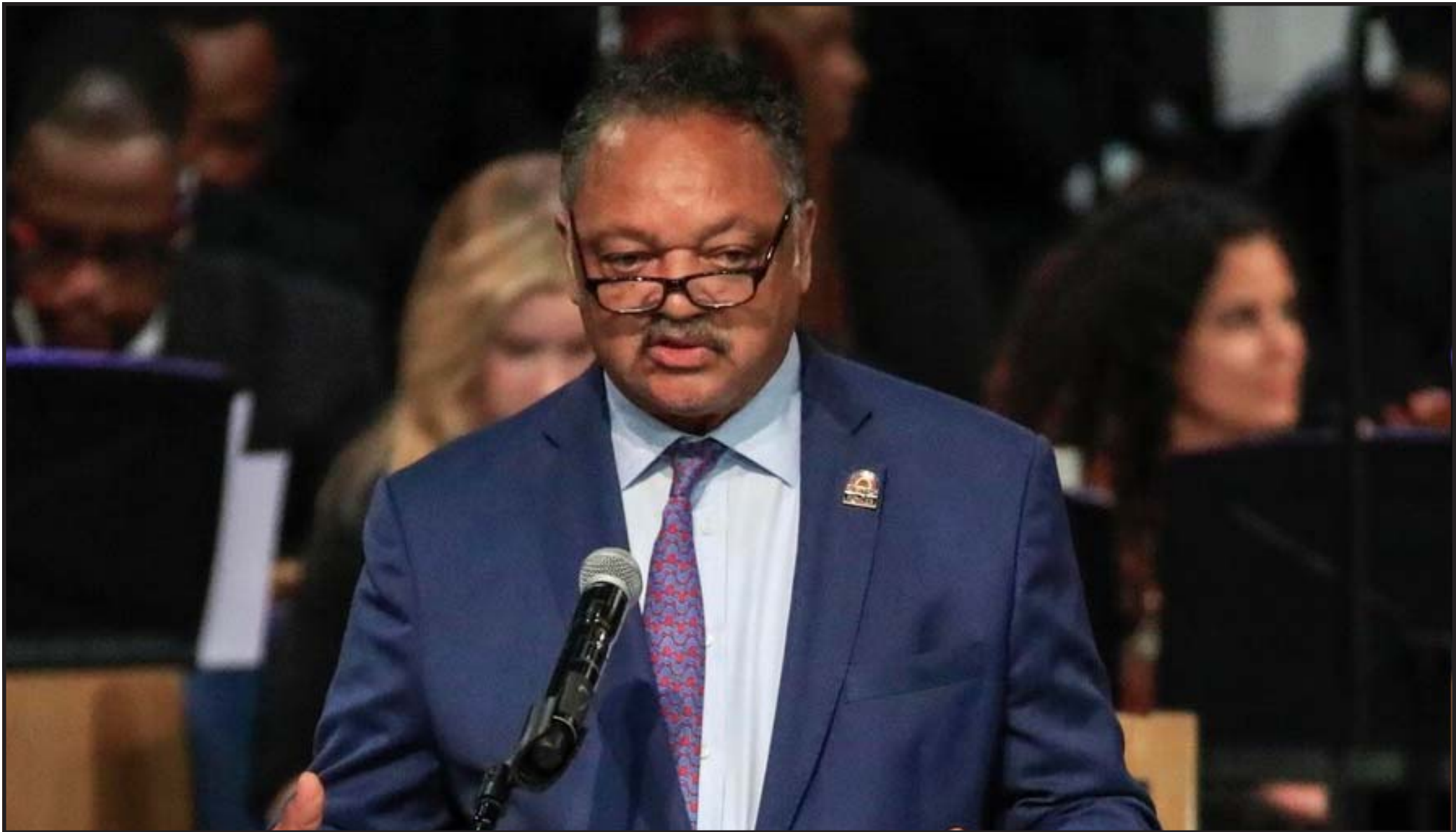
El reverendo Jesse Jackson habla durante el funeral de la cantante estadounidense Aretha Franklin en el Greater Grace Temple en Detroit, Michigan, USA., 31 de agosto de 2018