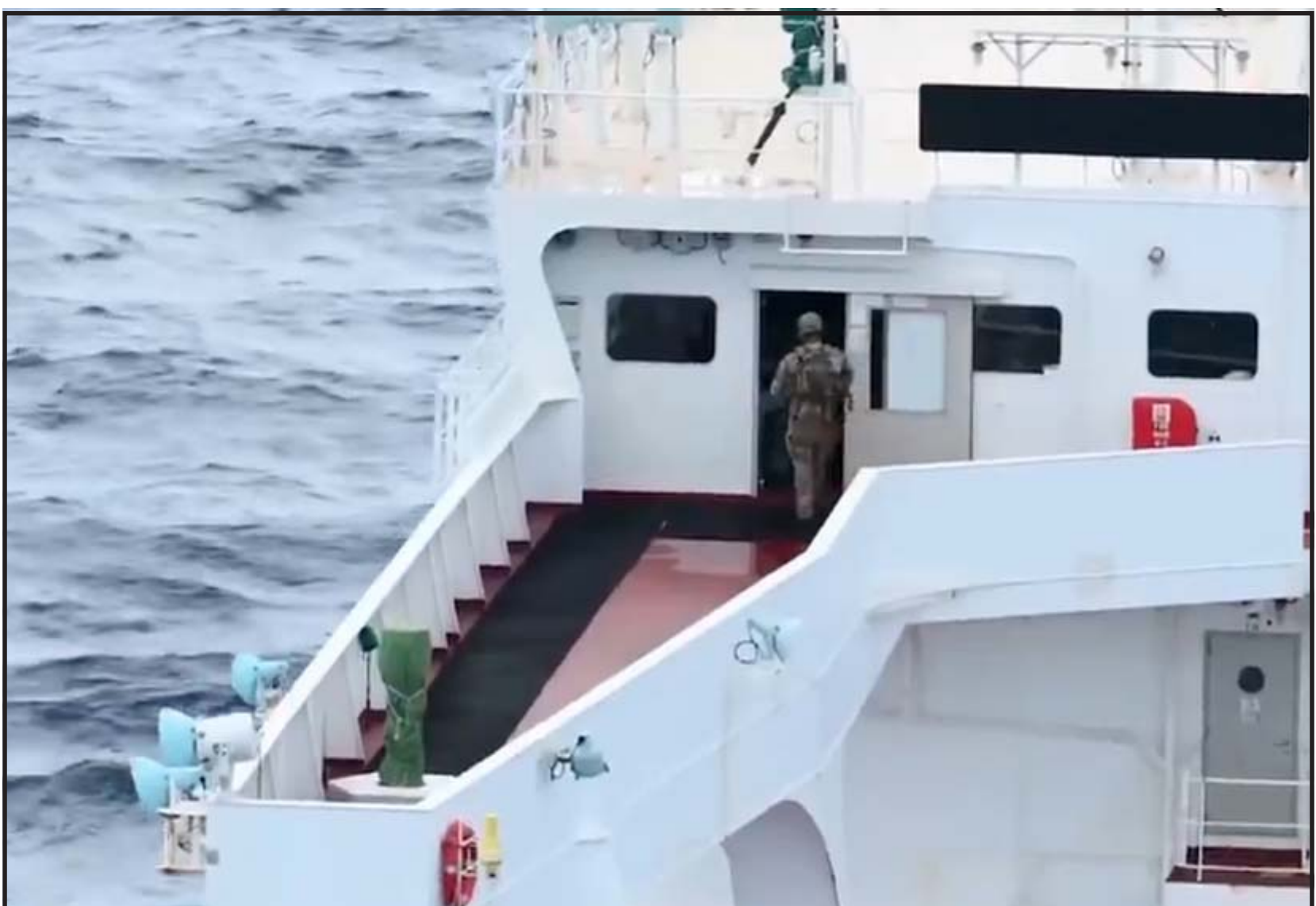
Momento en que soldados de EEUU interceptan un buque petrolero en el océano Índico.

el Latino Semanal El Departamento de Defensa de Estados Unidos anunció este domingo que interceptó en el océano Índico a otro petrolero que, según Washington, violaba el bloqueo impuesto a las operaciones de crudo en el Caribe relacionadas con Venezuela y Cuba y trató de escapar del cerco estadounidense. “Durante la noche, las fuerzas estadounidenses llevaron a cabo una visita de derecho de inspección, interdicción marítima y abordaje del Veronica III sin incidentes en el área de responsabi-